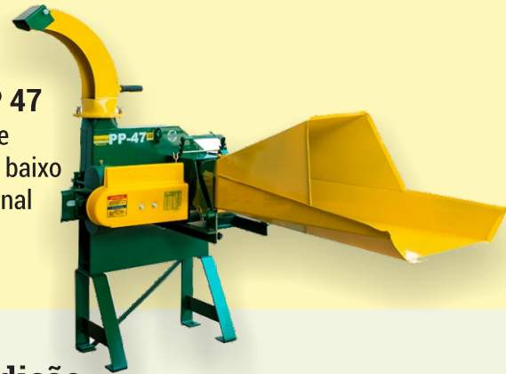
Picadeira PP 47 Produtividade e qualidade com baixo custo operacional

Recebeu o Premio Gerdau categoria NOVIDADE edição 2012, Top of Mind edição 2008 e o mais importante de todos: o reconhecimento do PRODUTOR RURAL pela marca PINHEIRO presente no mercado a 40 anos.