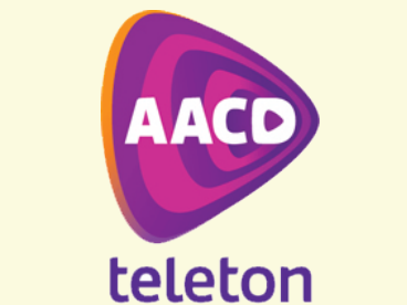
Figura 5: Logo AACD

O SBT, emissora de televisão brasileira, realiza o Teleton (figura 5) desde 1998. O evento transmitido pelo canal tem o intuito de arrecadar fundos para AACD (Associação de Assistência à Criança Deficiente). O programa possui maior carga horária dentro do segmento e conta com a parceria de outras emissoras e diversas empresas. A corrente de solidariedade que se expande pelo país, tornou-se uma das maiores fontes de recursos para a instituição, além disso gera mais confiança dos envolvidos perante os telespectadores.