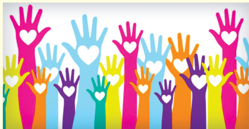
Figura 1: Marketing de Causa/Curadoria de Marketing