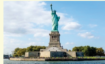
Figura 3: Estátua da Liberdade

Ao longo de um período de quatro meses, $ 1,75 milhões foram levantados para a restauração da Estátua da Liberdade, os novos usuários dos cartões American Express cresceram 17%, e houve um salto de 10% na emissão de cartões de crédito para novos clientes.