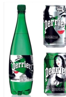
Fonte: < https://www.elle.fr/Elle-a-Table/Les-dossiers-de-la-redaction/News-de-la-redaction/Dita-Von-Teese-habile-la-bouteille-de-Perrier-1226163 >.