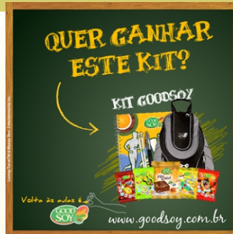
Figura 3: Concurso Cultural Good Soy

Contudo, é necessário frisar que a Good Soy vem se empenhando no âmbito da promoção e divulgação da marca. Em fevereiro de 2014, ela promoveu um concurso cultural no qual os participantes deveriam criar uma frase com as palavras Amor e Lanche, postando-a no mural de sua funpage . O concurso garantia como prêmio ao vencedor três kits volta às aulas recheados com seus produtos, resultando na participação de várias mães interessadas em tal prêmio e na consequente divulgação da marca.