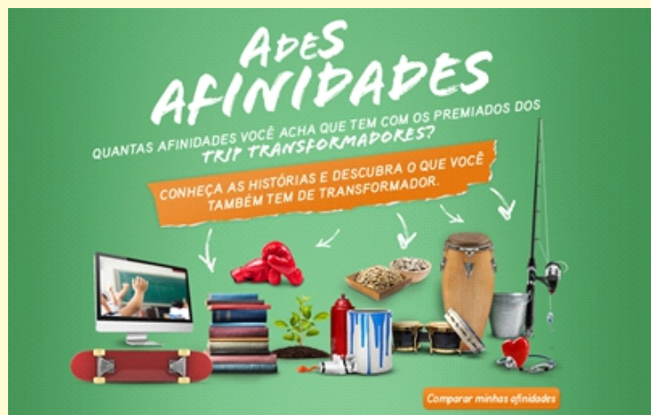
Figura 2: Ades Afinidades

Além desta campanha, a Ades, juntamente com a Chicabon (famosa marca de sorvetes), lançou uma vertente voltada ao público infantil. Tal vertente consiste nas aventuras, em forma de pequenos episódios e alguns jogos virtuais, de um leão chamado Max, juntamente com sua parceira e outros personagens que compõe “Magilika”, o mundo mágico ao qual pertence o personagem principal. Tal campanha possui um site próprio, em que as crianças podem jogar, assistir aos desenhos e conhecer mais sobre os produtos de ambas as marcas.